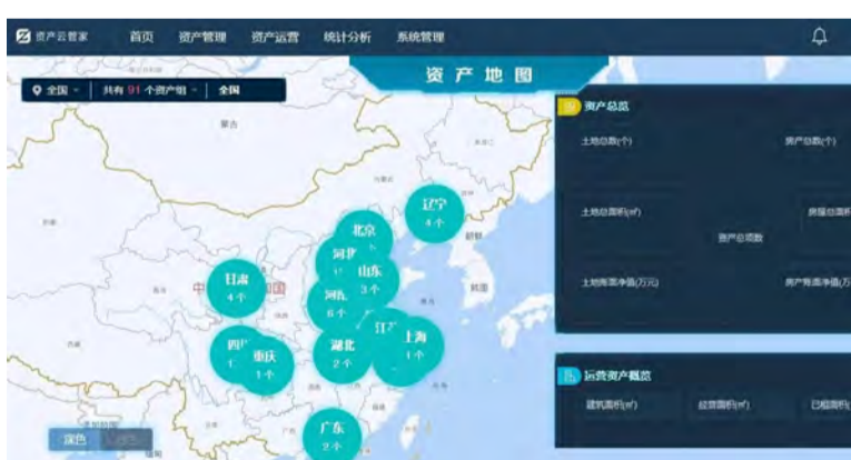
公司资产管理信息化平台正式上线