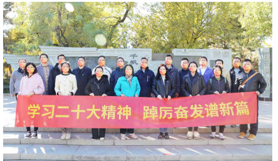
公司组织开展学习贯彻党的二十大精神主题活动

精益管理理念融入日常工作。 落实“精细化管理年”要求,大力推动精益文化营造和全员精益思想塑造。紧紧牵住改善提案这个“牛鼻子”,发布改善提案管理办法,明确奖励机制,全年累计收集改善提案超1000件,并加大专题宣传,开展改善提案PPT大赛,形成持续改善的精益文化浓厚氛围。中核华建年度整体成本费用率同比下降超5%,取得经营绩效“双提升”,有力保障年度经营目标实现。