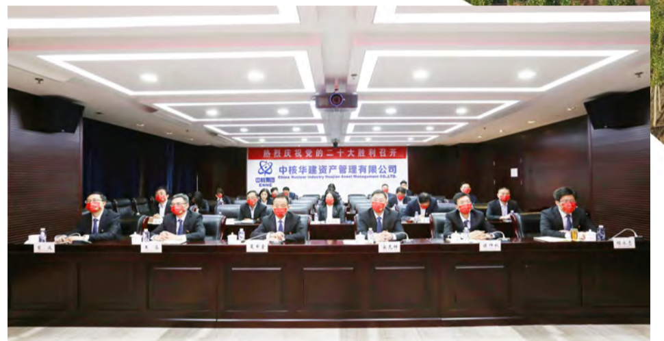
公司党委集中收看党的二十大开幕盛况

锚定高质量发展。 坚持以高质量党建引领保障高质量发展。2022年,中核华建实现营业收入同比增长14%,考虑减租加回,利润同比增长125%,推动完成所属3家单位法人压减工作,超额完成年度亏损企业治理任务,完成中核仪器国家级高新技术企业认证,推动中核长城757社区稳步移交,年度各项考核任务目标顺利实现,并在配合审计署对集团专项审计中实现“零问题”,发展的脚步愈发稳健。