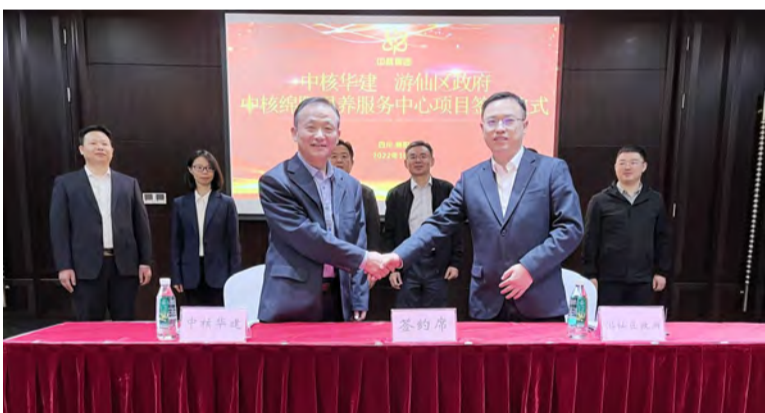
公司与绵阳市游仙区政府举行退养中心项目合作签约仪式

宏伟蓝图激荡人心,号角声声催人奋进。中核华建将深入学习贯彻党的二十大精神,以习近平新时代中国特色社会主义思想为指引,忠诚拥护“两个确立”,坚决做到“两个维护”,深刻领悟“三个务必”,认真落实集团公司党组、中国宝原党委各项工作部署,牢牢把握公司转型升级、跨越发展的关键历史机遇,大力弘扬新时代核工业精神,沿着“一二三”发展思路,一张蓝图绘到底,一锤接着一锤敲,稳健推进“十四五”发展规划落实见效,不断深化体制机制改革,守正创新、团结奋斗,敢为、敢闯、敢干、敢首创,用实干实绩践行党的二十大精神,奋进新征程、书写新答卷。