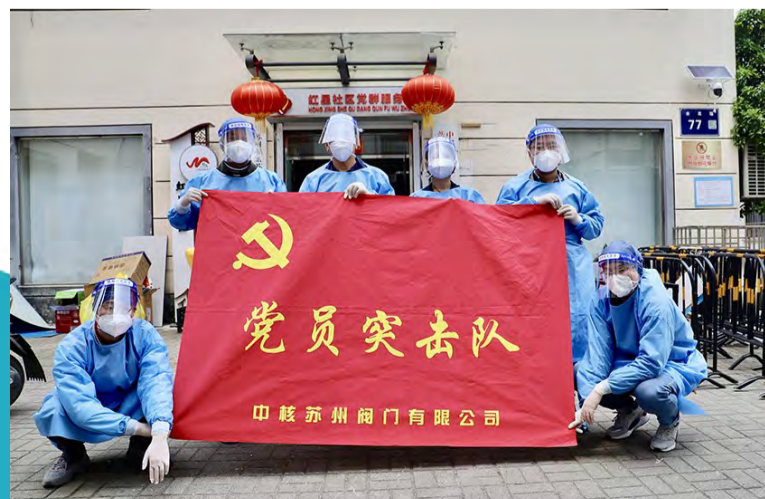
中核苏阀组建党员突击队参与地方抗疫